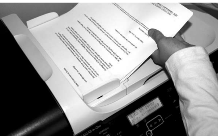
Mit einem Einzugsscanner und der passenden Software-Unterstützung ist das Einlesen der Daten kinderleicht.

Die Befragung per Papierfragebogen ist unabhängig von Ausstattung der Schule und der Verfügbarkeit eines Computers im Elternhaus.