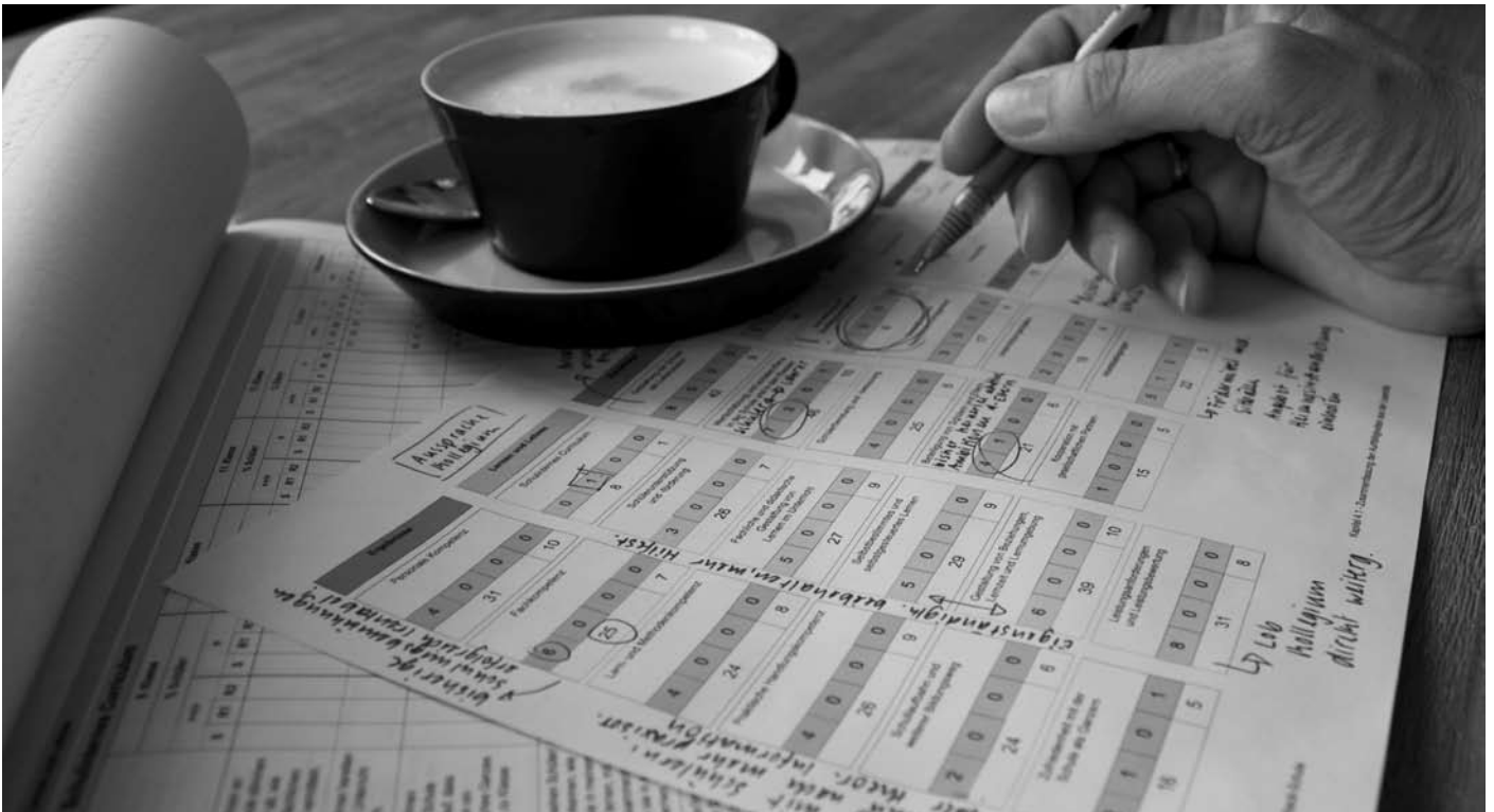
Die ganze Schule im Blick. Der SEIS-Bericht einer Schule enthält eine einseitige Zusammenfassung der Ergebnisse (Kapitel 4.1). Diese Übersicht erleichtert den Einstieg in die Details.

Um die Technik für die Befragung und die Erstellung des Berichtes muss sich die Schule dabei nicht kümmern. Die Schule kann sich somit voll auf die Analyse und Interpretation der Befragung konzentrieren. Schließlich ist die Evaluation kein Selbstzweck, sondern die Grundlage für eine darauf aufbauende Schulentwicklung. Auf die Interpretation der Befragungsergebnisse folgt die Planung von Maßnahmen, wie beispielsweise von Schritten, um ein Förderkonzept umzusetzen. „SEIS hat uns in unserer Entwicklung sehr geholfen“, folgert Richard